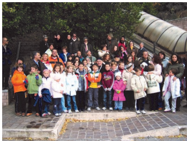
GITA AD ASSISI

SI RACCOMANDA LA PARTECIPAZIONE DI TUTTI! GRAZIE